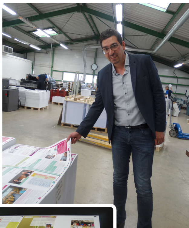
Jean-François WEBER