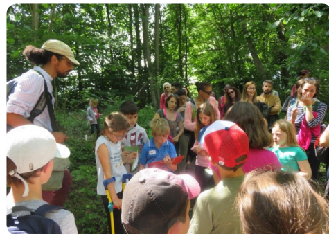
Sortie nature grand public

Environnement de la commune, des arbres près de la gravière mais aussi des plantes mellifères au jardin partagé (cf. photo 4 ème de couverture), lesquelles ils avaient d'abord semées dans les serres municipales. Sans oublier les nids de canard qui ont été fabriqués avec M. WEINUM et ensuite posés à différents endroits dans le Muhlgiessen.