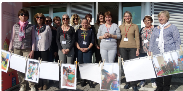
Les Assistantes maternelles du RAM

Les ateliers éducatifs proposés (ateliers de musique, activités manuelles...) constituent des temps d'éveil et de socialisation pour les enfants accueillis prioritairement par des assistantes maternelles.