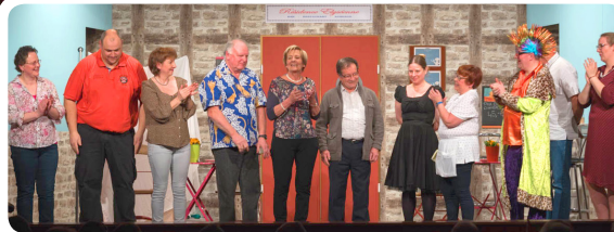
La Troupebadour avec l'auteur de la pièce Paul COTE

N'hésitez pas ! Cela sera notre lien, nous comptons sur vous.